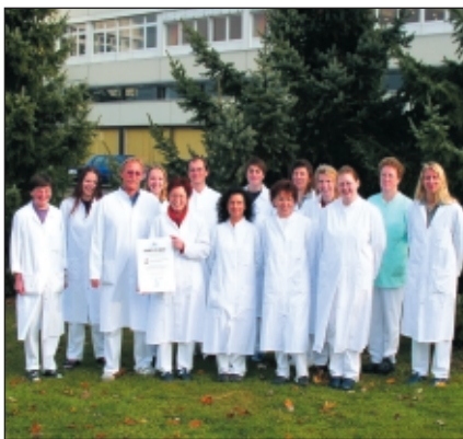
▲ Mitarbeiter der Zentralapotheke mit Zertifikat